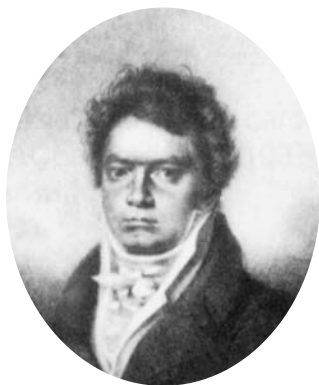
Ludwig van Beethoven. Gerollter Punktierstich von Blasius Höfel, nach einer Bleistiftzeichnung von Louis Letronne, 1814, Gesellschaft der Musikfreunde, Wien.

Annahmen können nur garantiert werden, wenn Anmeldung (inkl. aller geforderten Unterlagen) und Teilnahmegebühr spätestens am 30. September 2008 im Sekretariat, Universität für Musik und darstellende Kunst, Lothringerstr. 18, 1030 Wien, Austria, eingetroffen sind. Nach Einlangen der Teilnahmegebühr wird die Anmeldung schriftlich bestätigt und erlangt damit erst Rechtsgültigkeit. Die Rückzahlung der Teilnahmegebühr ist auch bei Nichtteilnahme nicht vorgesehen. Durch die Anmeldung erklären sich die Teilnehmer mit den Wettbewerbsbestimmungen einverstanden.